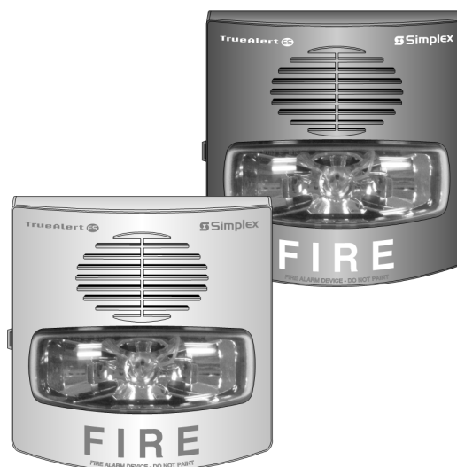
Figura 1: Los aparatos A/V direccionables TrueAlert ES están disponibles en rojo con texto en blanco o blanco con texto en rojo