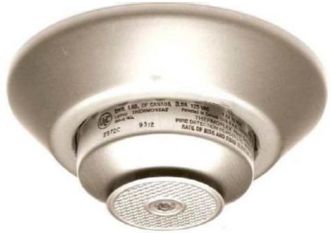
Illustration 1 : Détecteur de chaleur, série 4255

La version à température fixée uniquement a la même taille et le même style de fabrication que la version combinée (thermovélocimétrique et thermostatique), mais sans l'élément de vitesse d'augmentation.